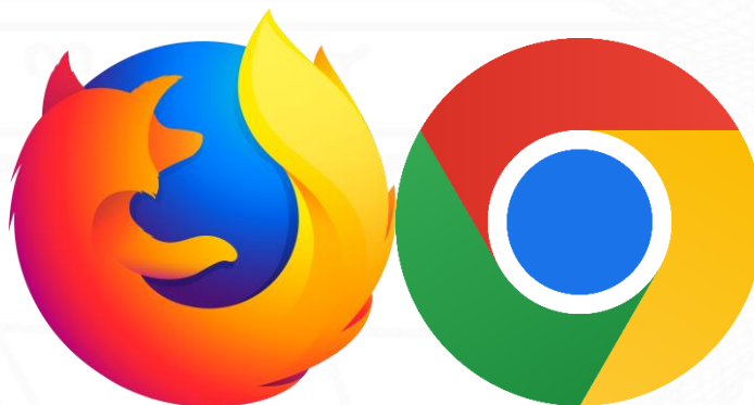
Logo de Mozilla Firefox y Google Chrome

Paso 1: El usuario deberá ingresar desde un dispositivo a la plataforma GOB.EC a través de un navegador de internet (como Mozilla Firefox o Google Chrome).